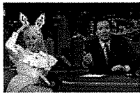
Miley Cyrus se lo pasa en grande en el programa de Jimmy Fallon