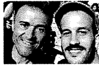
Luis Enrique, espectador de lujo en el concierto de U2