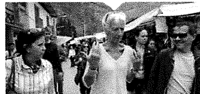
La directora gerente del Fondo Monetario Internacional,