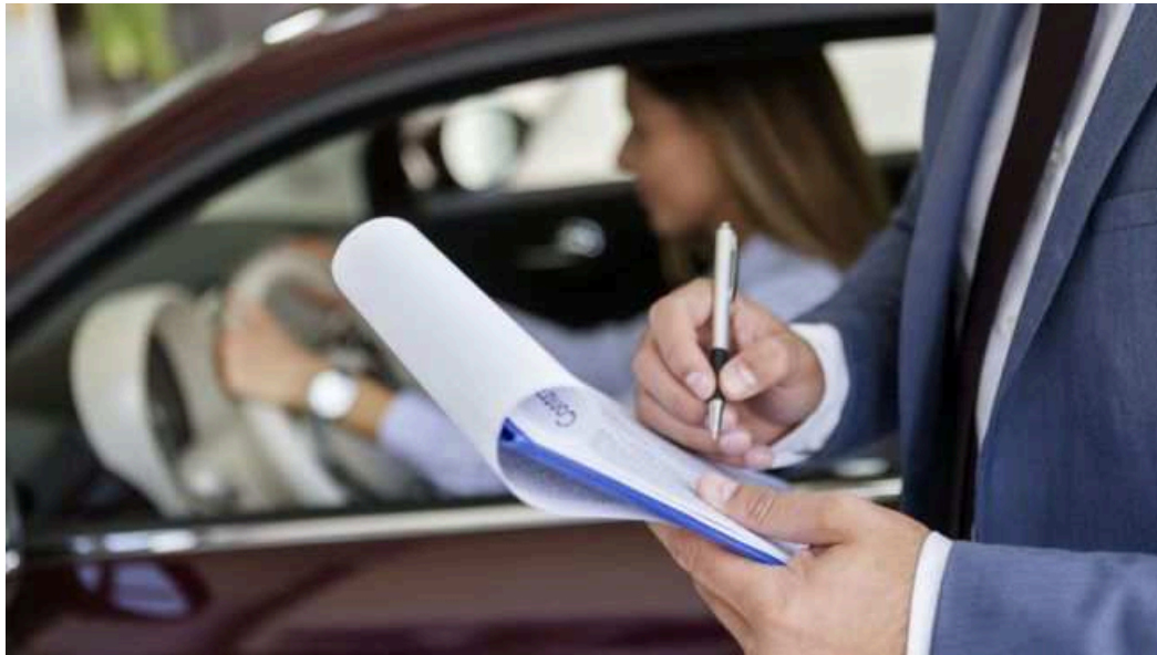
Cómo aprobar el examen de conducir paso a paso