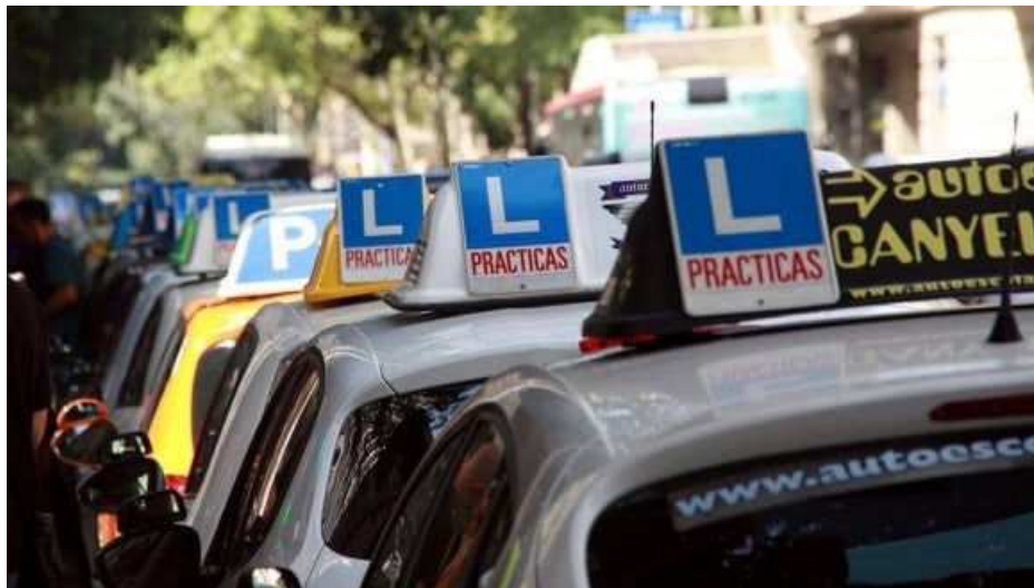
El nuevo examen de conducir es más caro si suspendes el práctico

La DGT pretende desde hace tiempo endurecer a los conductores los requisitos para aprobar el carné de conducir . El objetivo es que estén más preparados y concienciados ante la nueva movilidad (patinetes, bicicletas, etc), los peligros de utilizar el teléfono móvil al volante o las distracciones, incluso con testimonios de personas afectadas. Además, impondrán la obligatoriedad de dar cinco clases prácticas en la autoescuela después de cada examen práctico suspendido .