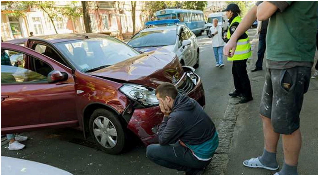
Aumentan los accidentes laborales de tráfico