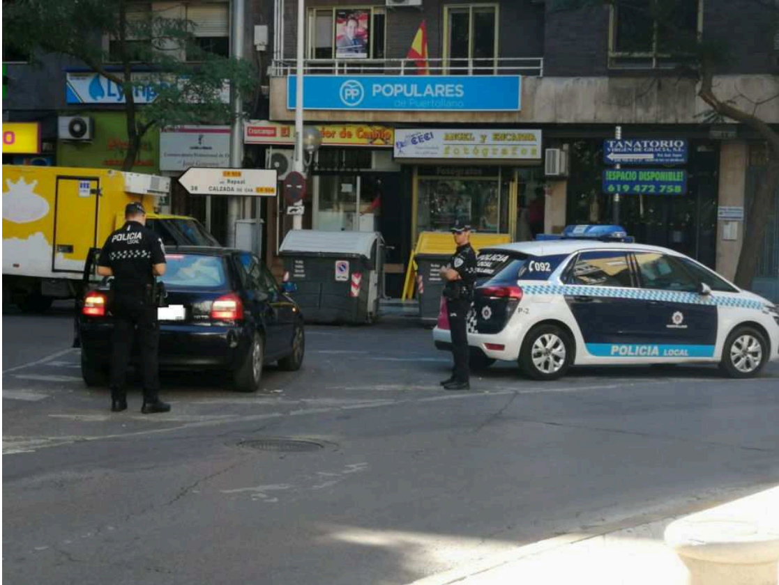
La Policía Local ha realizado una campaña en estos días

Una campaña sobre el uso del cinturón de seguridad y los elementos de retención infantil es la que ha realizado en estos días la Policía Local, han sido varias las sanciones que se han puesto por los agentes locales a conductores que no cumplían con su obligación