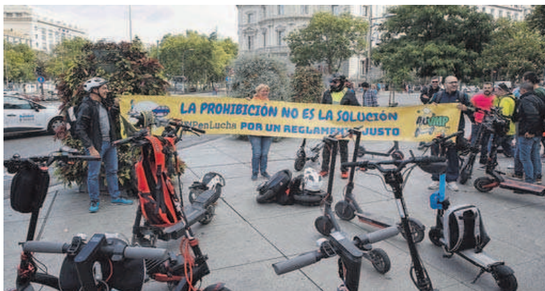
Contra las restricciones. No todos esperan que se apruebe la regulación de la DGT. En Madrid, grupos de usuarios se manifestaron contra las prohibiciones que prepara Tráfico.

El de los patinetes eléctricos en las ciudades es uno de los asuntos que abordó la pasada semana el fiscal de seguridad vial de Galicia, Carlos Gil, con los representantes de las policías locales de