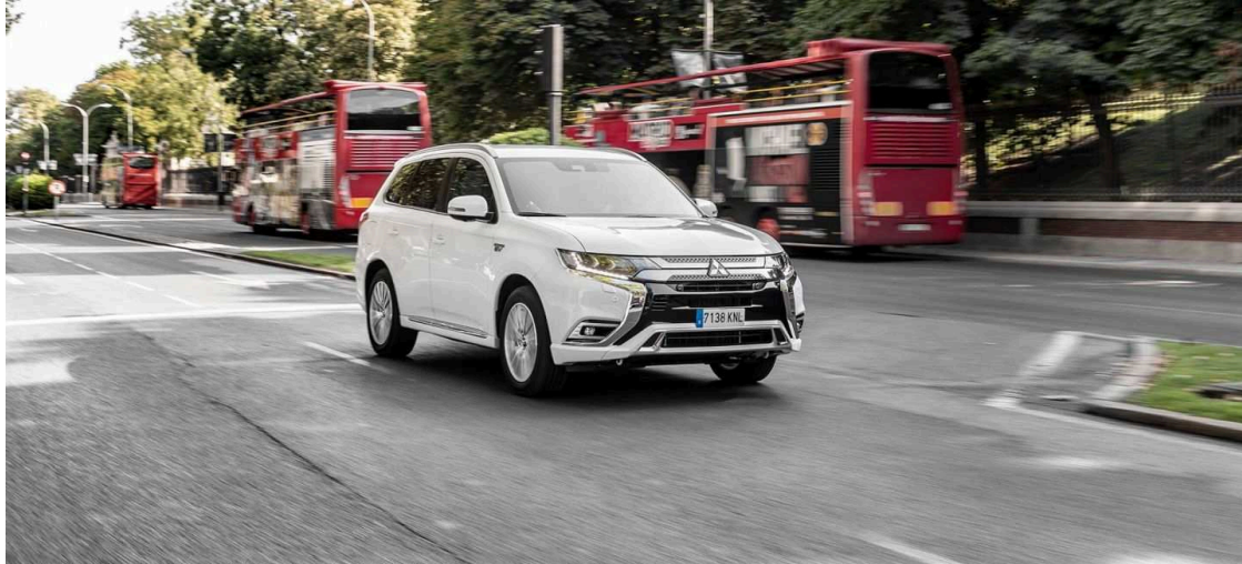
Velocidad 30 Km/h Ciudad Madrid Mitsubishi

Objetivo: calmar el tráfico. Así define la Dirección General de Tráfico uno de los cambios en la normativa que tiene preparados, de momento como borrador, para su próxima reforma del Reglamento General de Circulación. La DGT limitará la velocidad a 30 km/h en ciudad , obviamente, en zonas muy concretas, en calles de carril único y de un carril por sentido . Ahora bien, ¿en qué consiste esta norma? Y lo que no es menos importante, ¿es necesaria esta medida?