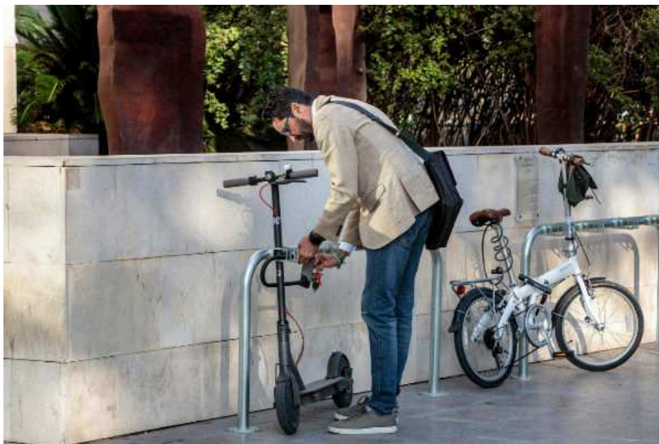
Un usuario de un patinete le pone un candado en Valencia

Así lo declaró el director general de Tráfico, Pere Navarro, en la presentación de la campaña "Por aquí no puedo, por aquí no paso"