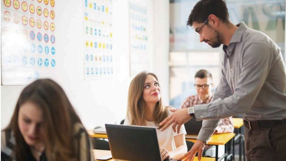
CIRCULA SEGURO F PRESENCIAL 2

En España no es obligatorio ir a la autoescuela para examinarnos del examen teórico. Las clases de formación teórica son totalmente voluntarias, lo que ha llevado a muchos a prepararse el examen por su cuenta, bien por falta de tiempo libre o para ahorrarse el precio de las clases. Por otro lado, la gran difusión de internet y los soportes digitales han propiciado la aparición de las autoescuelas y plataformas online .