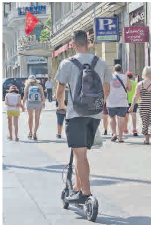
Un conductor de patinete eléctrico, por una acera

Carabante aprovechó la ocasión para censurar que las autorizaciones de la anterior Corporación municipal de Manuela Carmena "no han