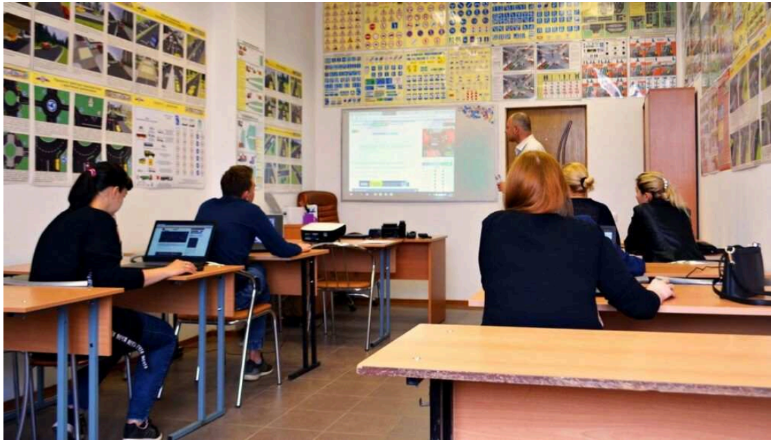
CIRCULA SEGURO F PRESENCIAL 1

La nueva convocatoria de la DGT para formar profesores de autoescuela expira hoy 7 de febrero. Y podría ser una de las últimas, ya que todo indica que el Gobierno obligará en breve a cursar una Formación Profesional (FP) para desempeñar esta actividad.